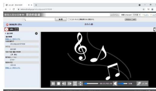
歴史的音源(れきおん)の再生画面

※開館日/休館日は、当館カレンダー、ホームページ、Twitterなどでご確認ください。